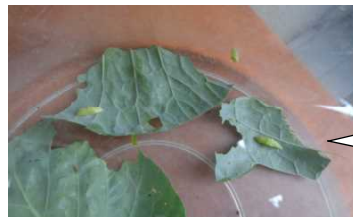
3年 モンシロ チョウ