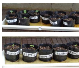
3年 ホウセンカ・ピーマン ・オクラ