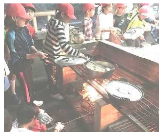
(野外炊事 すきやきづくり)

自然体験を通して、自主・自律の態度を身につけようと、5年生のみなさんがチャレンジしました。