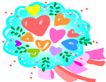
元気な声で 校歌を歌いました