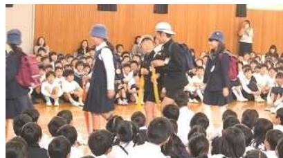
早小クイズ 雨の日の傘の使い方

最後にくす玉を開きました。「これからもよろしくね。」と書かれた垂れ幕が下がり、風船や紙吹雪が舞う中で大歓声がわき起こりました。とても楽しくて温かい会になり、計画した6年生も満足そうでした。