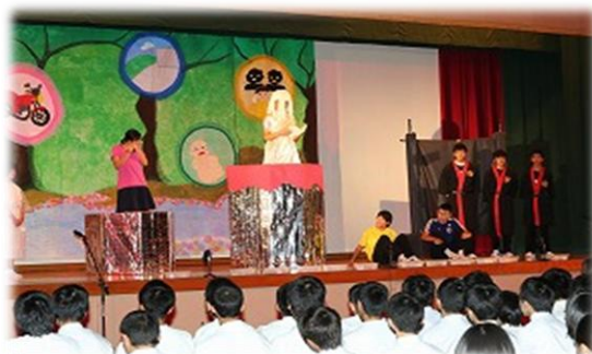
一人一人のセリフに熱いメッセージが・・・

いよいよ3年生は大きな行事を終え、自らの進路に向け本格的に学習に取り組んでいくこととなりますが、夢を掴むことができるよう頑張ってください。応援しています。