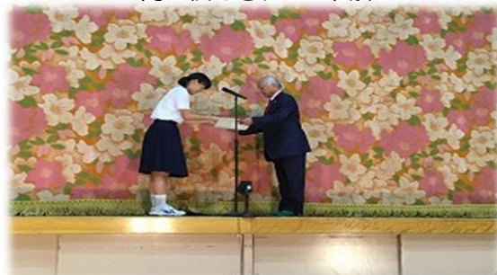
生徒会長から感謝状を贈呈させていただきました