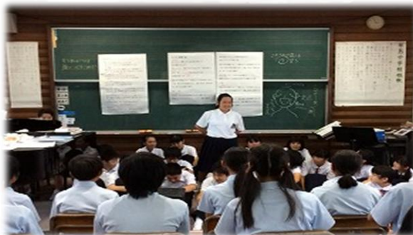
1年生は真剣に聞き入っています

1・2年生の合唱は、日頃の音楽の授業で学んだことをもとに、歌声に強弱をつけたり伸ばしたりと、工夫しながら取り組んでいたため、どのクラスも素晴らしいできでした。甲乙つけがたい合唱に、採点者はみんな随分悩まされました。初めての合唱に臨んだ1年生は元気よく歌い、とてもすがすがしかったですし、2年生の歌には元気良さに加え、四部合唱やソロを取り入れるなど、美しいハーモニーで、見ている（聴いている）人たちが合唱に引き込まれるような感じで とても感動的 でした。早輝祭終了後の音楽の授業で1年生が、2年生が歌っていた歌を歌いたいと言っています。 さすが先輩 です。これからも しっかりと1年生を引っ張っていってくれることを期待 しています。