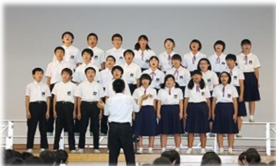
大きく口を開けて体全体で表現しています

1・2年生の合唱は、日頃の音楽の授業で学んだことをもとに、歌声に強弱をつけたり伸ばしたりと、工夫しながら取り組んでいたため、どのクラスも素晴らしいできでした。甲乙つけがたい合唱に、採点者はみんな随分悩まされました。初めての合唱に臨んだ1年生は元気よく歌い、とてもすがすがしかったですし、2年生の歌には元気良さに加え、四部合唱やソロを取り入れるなど、美しいハーモニーで、見ている（聴いている）人たちが合唱に引き込まれるような感じで とても感動的 でした。早輝祭終了後の音楽の授業で1年生が、2年生が歌っていた歌を歌いたいと言っています。 さすが先輩 です。これからも しっかりと1年生を引っ張っていってくれることを期待 しています。