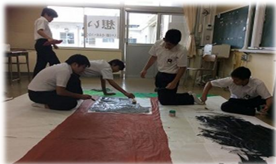
劇を盛り上げるための大事な作業です

3年生の劇は、それぞれのクラスが持ち味を十分発揮し、家族の存在のありがたさ、あきらめず前を向いて生きていくことの重要性など、見ている人たちに忘れてはならない大切なメッセージを届けてくれました。3年生が真剣に演じる姿に見てくださった方々からは、「とても感動しました」との言葉をいただきました。演じる人のみでなく、背景画などの大道具や小道具を作成した人、照明やBGMを担当した人など、 みんなが力をあわせて一つのことを創りあげていく姿はとてすばらしかったです。1・2年生の良きモデル、尊敬すべき憧れの先輩 の姿を見せてくれました。 さすが最上級生 です。