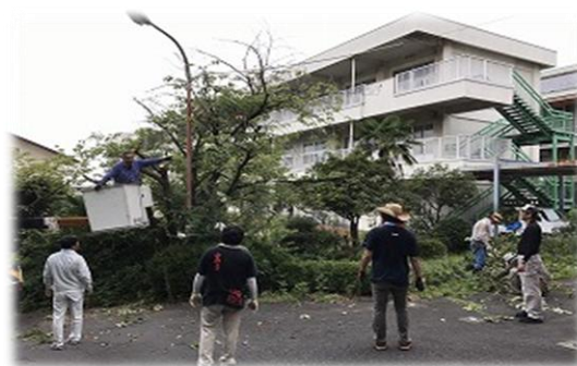
高い枝もきれいに伐採