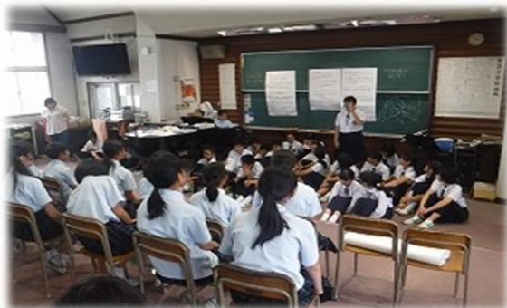
気がついたことを助言しています

また、1年生が2年生と合同で練習し、先輩から助言をもらっている風景も見られました。1年生のやる気が一気に向上したきっかけとなったようです。まさに 生徒の、生徒による、生徒のための 早輝祭で、 自主的かつ主体的に取り組む姿に大きな成長を感じ ることができました。