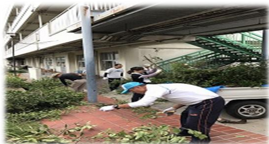
みんなで黙々と作業

最後に、8月26日（土）、「はやしま学園運営協議会」が中心となって呼びかけを行い、約30名の地域や保護者の方々に早朝から学校の木々等の伐採や剪定等を行っていただきました。見違えるように美しくなった学校を見て生徒たちはびっくりです。早輝祭で、生徒を代表して生徒会長から感謝状を贈呈させていただきました。生徒は多くの方々に支えていただいていることに感謝し、勉強に部活に一層頑張ってくれることだと思います。本当にありがとうございました。