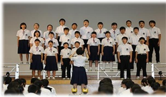
難しい四部合唱に挑戦！さすが2年生