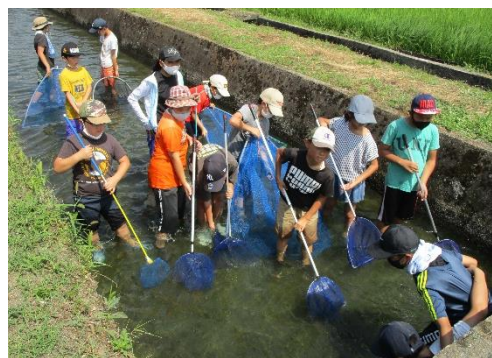
わくわくサマーホリデー