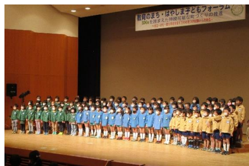
はやしま子どもフォーラム