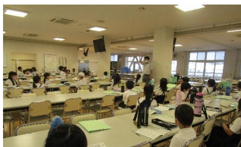
放課後はやしま塾