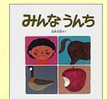
『みんな うんち』 五味 太郎(さく・え) 福音館書店

夜、コッコさんは「コッコはまだねむらないもん」と言ってなかなかねむりにつけません。コッコさんのまわりのものたちがねむっていき、とうとう・・・!?やさしいやりとりをゆったり楽しめます。