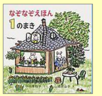
『なぞなぞえほん 1のまき』 中川 李枝子(さく) 山脇 百合子(え) 福音館書店

行きたくなったら我慢しないで行くところって、どこ？ ぐりとぐらと動物たちが、なぞなぞをたくさん紹介しています。 「なぞなぞごっこ」で子どもと知恵比べしてみてください。思わぬおもしろい答えが出てくるかも！?2のまき、3のまきもあります。