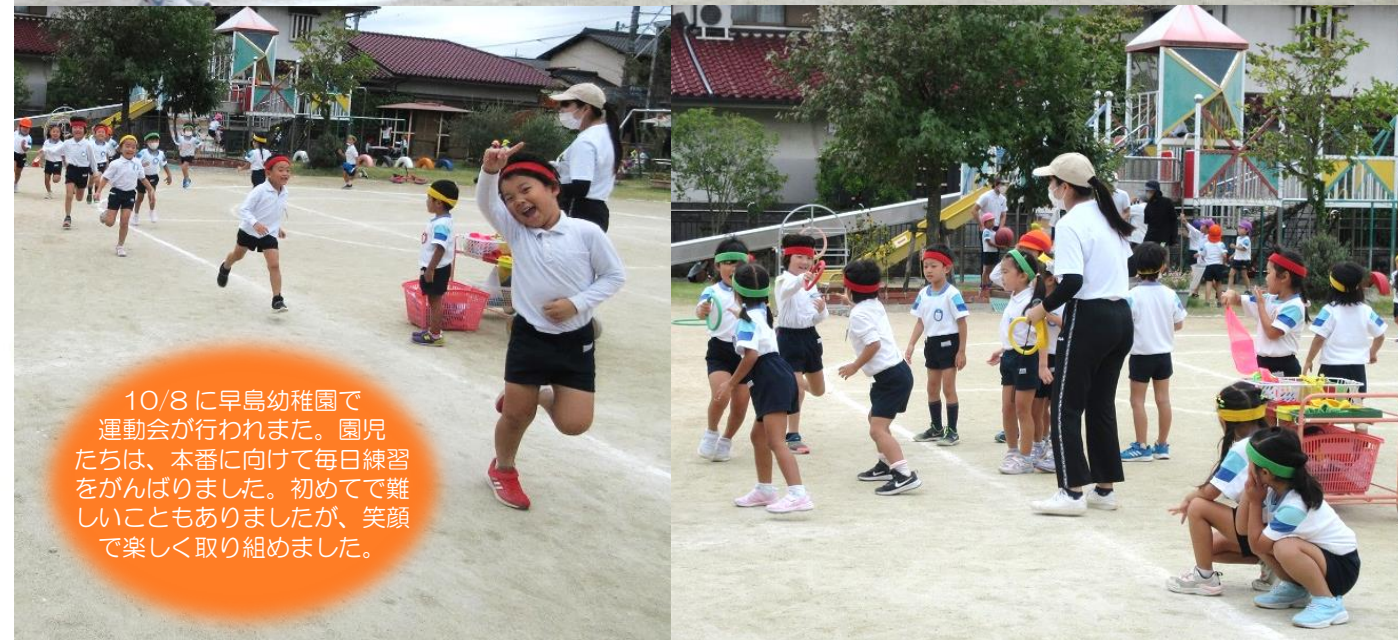
10/8に早島幼稚園で運動会が行われました。園児たちは、本番に向けて毎日練習をがんばりました。初めてで難しいこともありましたが、笑顔で楽しく取り組みました。