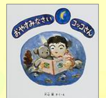
『おやすみなさい コッコさん』 片山 健(さく・え) 福音館書店

行きたくなったら我慢しないで行くところって、どこ？ ぐりとぐらと動物たちが、なぞなぞをたくさん紹介しています。 「なぞなぞごっこ」で子どもと知恵比べしてみてください。思わぬおもしろい答えが出てくるかも！?2のまき、3のまきもあります。