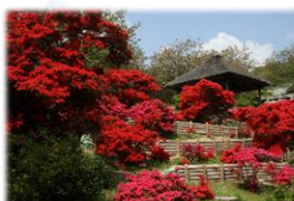
⑤5月には境内のツツジやフジが咲き乱れます。