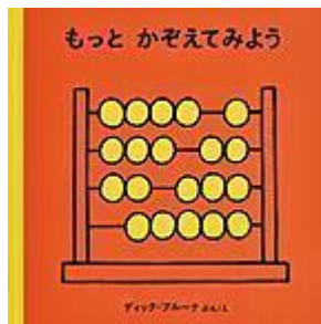
『もっと かぞえてみよう』 ディック・ブルーナ (ぶん・え) 福音館書店

ピエロがお手玉をしているボールは13個。雲から落ちてくる雨粒は14個。明快な形と美しい配色で数の世界を描いた、わくわく楽しい数の絵本。