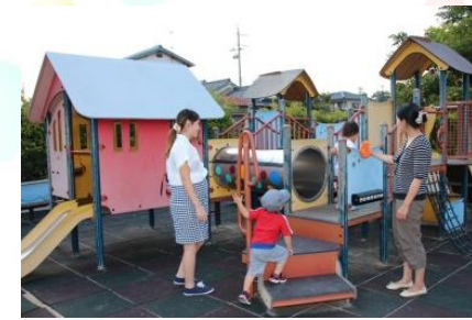
すべり台やトンネルくぐりなどができ複合遊具

早島町には、子ども同士、保護者同士の遊びや交流をとおして、仲間作りができる場所がたくさんあります！育児の悩み相談や情報交換もできて便利。毎号1か所ずつ紹介していきます。