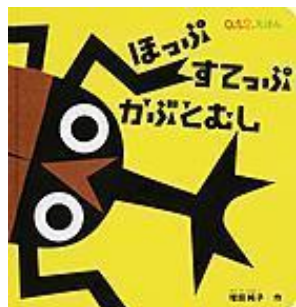
『ほっぴ すてっぴ かぶとむし』 増田 純子 (作) 福音館書店

かぶとむしくん、かたあし あげてけんけんけん。次は、りょうあしつけて…、じゃーんぶ！一緒に体を動かしながら楽しめます。