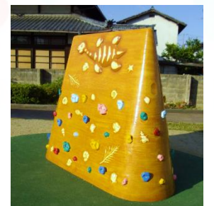
今年新登場のボルダリングで壁登りを楽しめます。