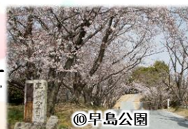
⑥桜がきれいなお花見スポット。広場や芝生すべり台もあります。