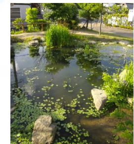
自然の水辺を再現したピオトープ