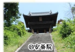
②安養院 真言宗の寺院。長い石段を登り切った後の景色は最高！