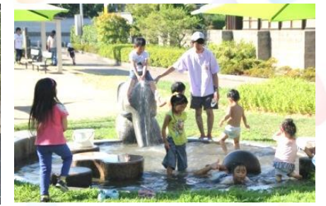
夏場に大人気！自由に水をためて遊べるそうさんの池