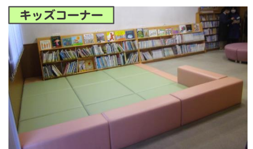
靴を脱いでゆっくりと絵本を楽しめます。時代を超えて読み継がれている定番絵本や昔話の絵本もそろえています。

定例のイベントも実施しています ボランティア団体や図書館職員による定例のイベントも館内で実施しています。紙芝居や絵本読み聞かせ、ストーリーテリング(語り)等、普段とは一味違う雰囲気でお話を楽しめますので、ぜひご参加ください。 ※2021.1.5現在、新型コロナウイルス感染症対策として、「かみしばいのじかん」と「ストーリーテリング」は中止していますのでご了承ください。再開時は図書館ホームページでお知らせします。