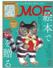
『月間 MOE (モエ)』 人気の絵本やキャラクター特集のほか、アート、映画、旅、スイーツ等、旬の情報も盛りだくさん。