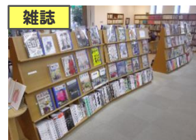
週刊誌や月刊誌のコーナー。最新号以外は貸出できます。