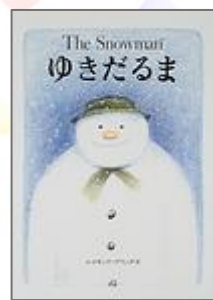
『ゆきだるま』 レイモンド・ブリッグズ(作) 評論社

「あれあれあれ おててはどこかな？」 手や顔や足がでて、 一人でおきがえができて いきます。 この絵本を使えば、 寒い朝のおきがえが 楽しくできるように なるかもしれませんよ。