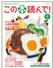
『この本読んで!』 絵本と読み聞かせの情報誌。おすすめの絵本や作家さんの紹介、読み聞かせのコツなどが満載。