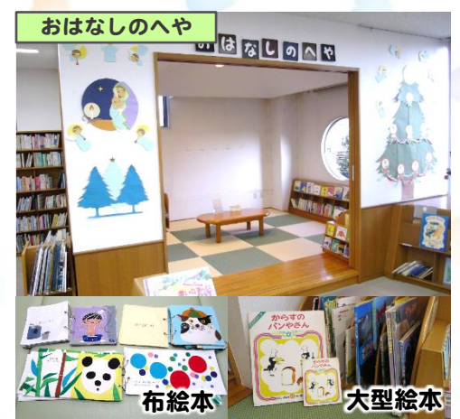
絵本の読み聞かせができる量の部屋です。あかちゃん向けの本(0歳~2歳)や布絵本、大型絵本などがあります。