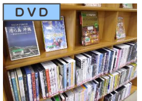
人気の映画や子ども向け等、DVDが一度に1点貸出できます。