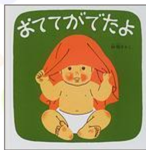
『おててがでたよ』 林 明子(さく) 福音館書店

「ゆーきやこんこ あられやこんこ ふっては ふっては ずん ずん つも る・・・♪」 雪がふるとみんなが くちずさむ雪の歌の 絵本。 楽譜もあります。く ちずさみながら楽し く読めます。