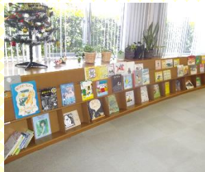
おすすめ絵本コーナー。表紙が見えるので、好みの絵で選ぶこともできます。

図書館職員にお気軽にお声がけください。また、おすすめ絵本コーナーや展示コーナーには、職員が厳選した絵本を並べています。さらに、雑誌コーナーには絵本がテーマの雑誌もあります。(雑誌も最新号以外は貸出可能。)お気に入りの絵本を見つけてください。