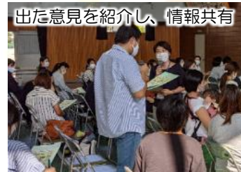
出た意見を紹介し、情報共有

今回は2人一組でグループワーク。「学校生活を迎えるにあたって不安なこと」を話し合い、保護者としてできることを考えます。