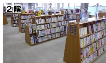
2階には、小説、学術書、郷土資料、CD、ティーンズコーナー、閲覧室などがあります。