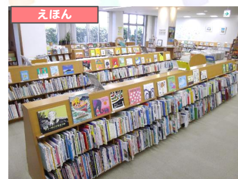
13,000冊以上の豊富な絵本があります。