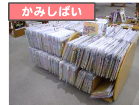
←700点以上の紙芝居が貸出可能。お家で気軽に紙芝居が楽しめます。