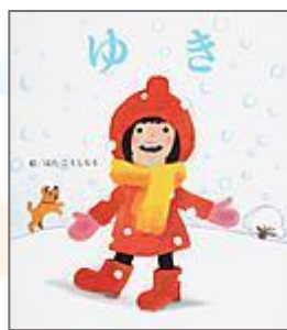
『ゆき』 はた こうしろう(絵) ひさかたチャイルド

→図書館司書が「読んでほしい」絵本をご紹介します！今回は「冬を楽しむ絵本」がテーマです。