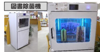
紫外線と風で本を除菌できます。本を入れてボタンを押すだけ。ぜひご利用ください。