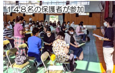
148名の保護者が参加

前号でご紹介した「ファシリテーター養成講座」の修了生のみなさんが学習プログラムの進行をします。