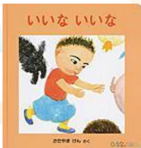
『いいな いいな』 かたやま けん(さく) 福音館書店

ぶうちゃんと、いぬやあひるなどの動物たちが体のあちこちを触って比べっこ。いぬさんのお顔はもしかもしゃ、ぶうちゃんはびかびかほっぺ。お互いを「いいな、いいな」と褒めあいます。「いいな」が口ぐせになりますよ。