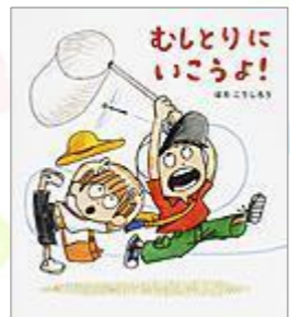
『むしとりにいこうよ!』 はた こうしろう(さく) ほるぶ出版

ぶうちゃんと、いぬやあひるなどの動物たちが体のあちこちを触って比べっこ。いぬさんのお顔はもしかもしゃ、ぶうちゃんはびかびかほっぺ。お互いを「いいな、いいな」と褒めあいます。「いいな」が口ぐせになりますよ。