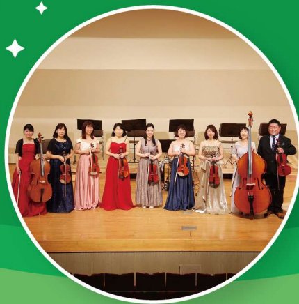
ゲスト：倉敷アカデミーアンサンブル

「早島ふるさと音楽祭」とは、ゆるびの舎開館15周年記念(2013年)につくられた、組曲「ふるさと早島」を歌い継ぐことを目的として毎年開催しています。地元早島町内の文化グループ・中学校吹奏楽部によるの発表とゲストステージを行い、最後に出演者全員で組曲「ふるさと早島」を盛大に演奏します。