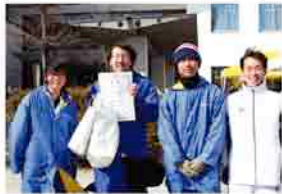
駅伝一般男子 チームFLEX