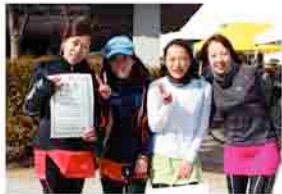
一般女子 児島の新星 駅伝各部門1位