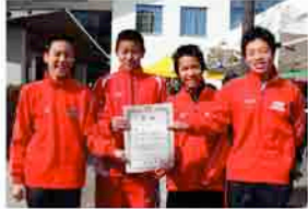
中学生男子 吉備高原マラソン愛好会F