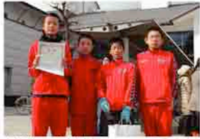
小学生 吉備高原マラソン愛好会E