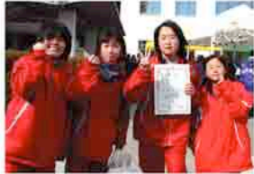
中学生女子 灘崎中