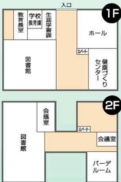
ゆるびの舎見取図