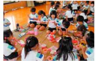
幼稚園年中組交流会