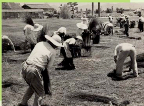
昭和20年代の早島い草の刈りとりの様子

しかし、畳を敷くという日本独自の生活様式は、どんなに人々のライフスタイルが変わろうと、必ず次代に受け継がれていくものです。そして私たちは、ここ早島がこの畳文化を担い発展させてきた地であるという事実と誇りを決して忘れることはありません。