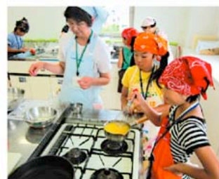
子ども料理教室の様子 “食”についての正しい知識を こどもの頃から育みます