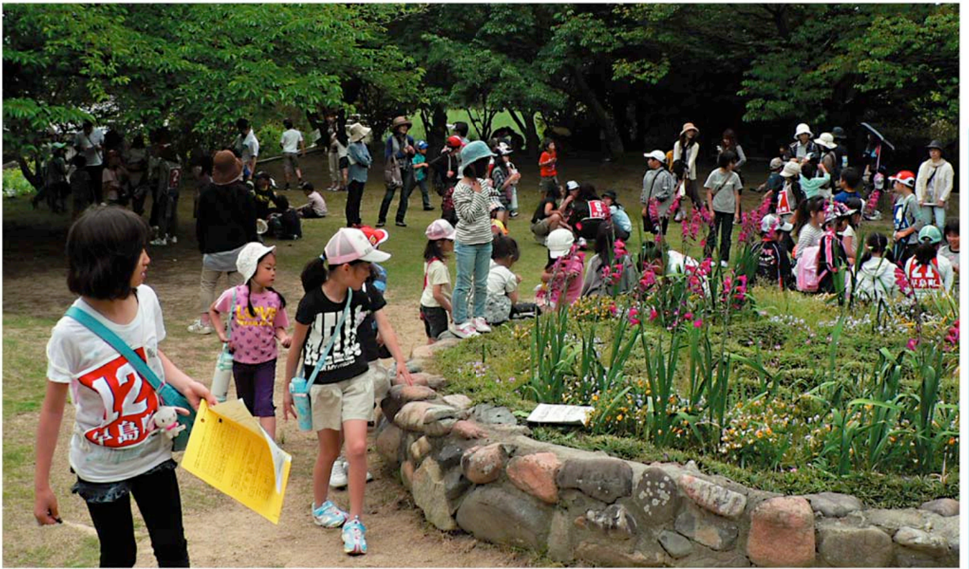
5月20日 子ども会野外研修 国鉾公園でクイズラリーを行う

超 高齢、長寿社会を迎え、高齢者を含むすべての人々が健康で、生きがいをもち、安心して暮らせる社会をどのように実現していくのが、今、大きな課題となっています。 そして、長寿化による余暇時間の拡大は、心の豊かさや生きがいを得たいという知的要求を高めるとともに、人々が地域で過ごす時間の増大をもたらしました。しかしその一方で、孤独に象徴される人と人とのつながりはしだいに希薄になり、地域コミュニティの崩壊が危惧されています。