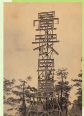
昭和50年代まで城山にあったネオン