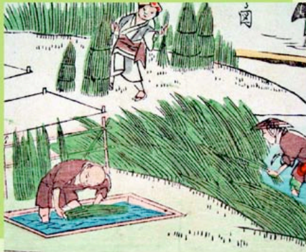
戦国時代の刈りとり・そぐり・泥染めの様子

その後江戸時代になると、児島湾の干拓とともに草の栽培は盛んになり、早島で織られた畳表は、早島表の名で全国に出荷されました。当時、早島の畳表は、江戸時代の小説家、滝沢馬琴の小説『夢相兵衛胡蝶物語』の中に「近頃、表かえした