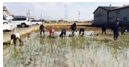
「早島農業体験協議会」FACEBOOK ページ参照 www.facebook.com/culturelinkproject

早 島農業体験協議会による「い草の文化」継承プロジェクトが本格始動。昨年12月に町内外のボランティアの協力で本田準備などを行いました。 同協議会はい草栽培の再開を通じて、土に触れる機会と、和の伝統文化を楽しむ場所の提供を目指しています。