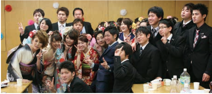
同窓の仲間とにこやかに