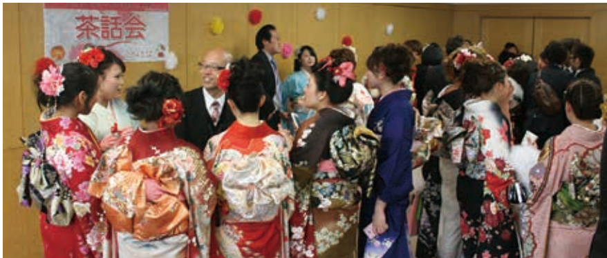
茶話会で恩師と談笑する新成人

ゆるびの舎で1月12日、平成26年成人式が行われ、109名（男性51名、女性58名）が新成人として新たな門出を迎えました。 式典では、大勢の保護者が見守る中、町長、議長、教育委員長から心温まる祝辞が贈られました。また、町からの記念品を男性を代表して薬