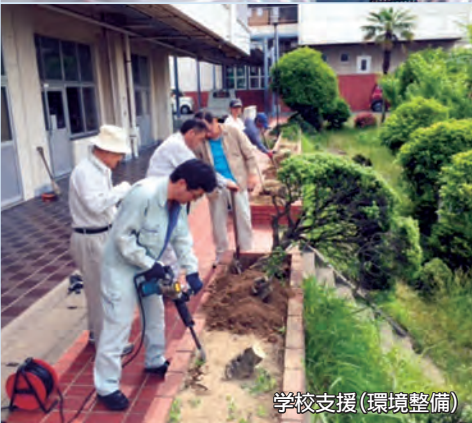
学校支援(環境整備)