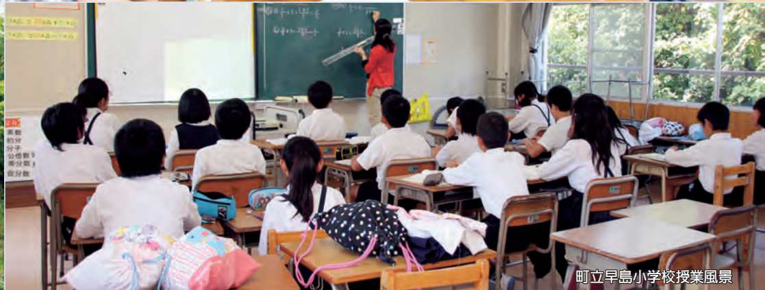
町立早島小学校授業風景