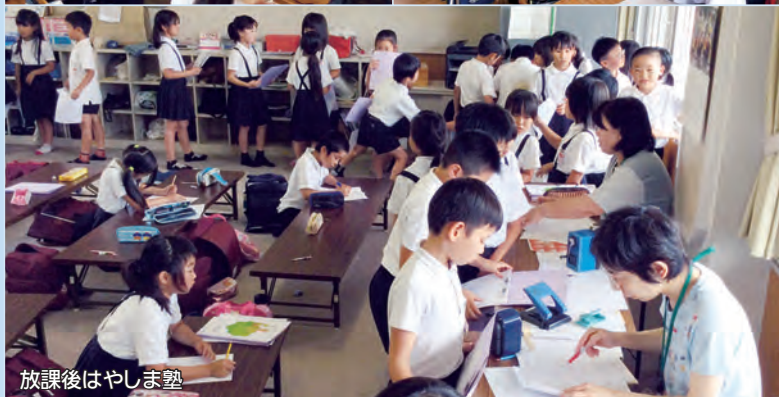
放課後はやしま塾