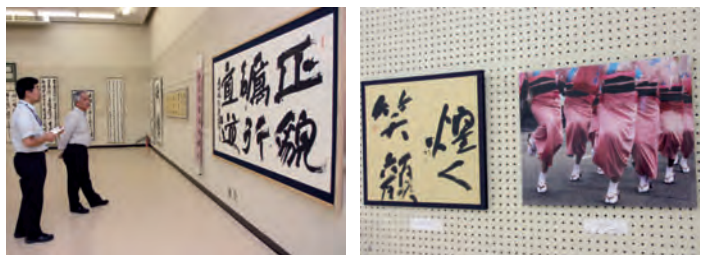
自らの作品の前にたたずむ澤田 虚遊氏 書 沼本 遊香氏