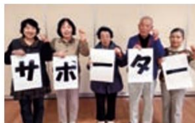
認知症サポーターになりました！

問 早島町地域包括支援センター (☎086・482・2432) 担当：小野 1 問い合わせください。みなさんも認知症サポーターになって地域の応援者になりましょう！