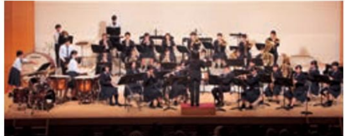
早島中学校吹奏楽部