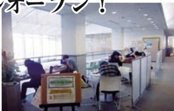
オープンスタディースペース

目の前には、ぞうさん公園の景色が広がり、足元のガラスはすりガラスになり、より安心快適な空間になりました。