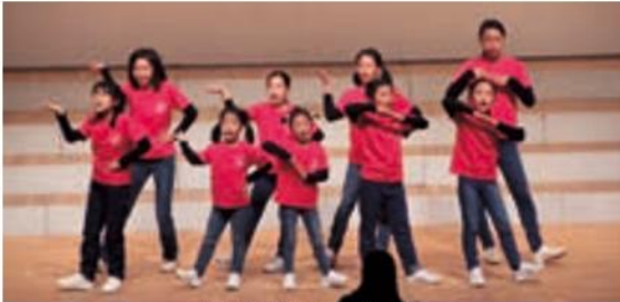
早島少年少女合唱団