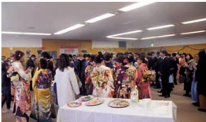
式典終了後の茶話会 久しぶりの再会に話が尽きません

大きくなった多くの仲間と過ごしたふるさと早島での成人式の一日は、二十歳を迎えた新成人たちの記憶に刻まれていくことでしょう。