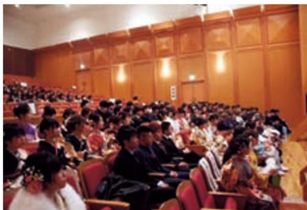
多数の新成人が集いました