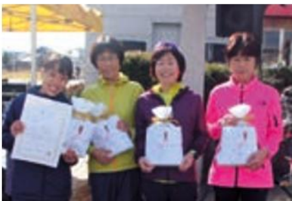
一般女子 ランプロRC女子A