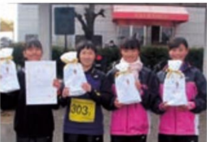
中学生女子 平成を飾るテニス部