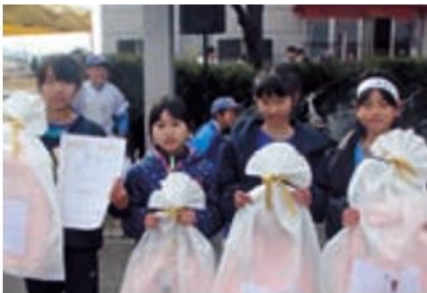
小学生女子 上南AC Gチーム