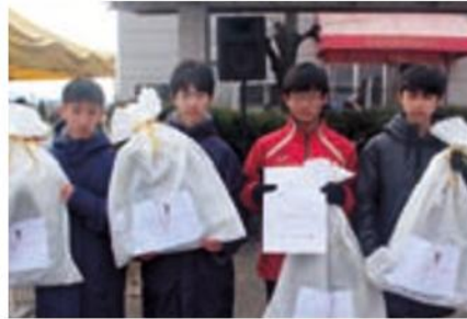
中学生男子 妹尾陸上部A