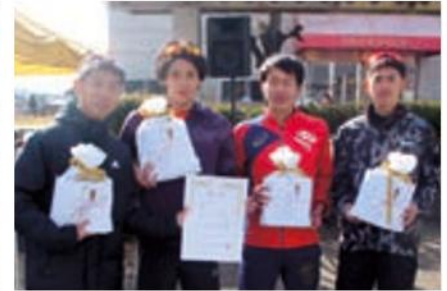
一般男子 ランプロRC男子A