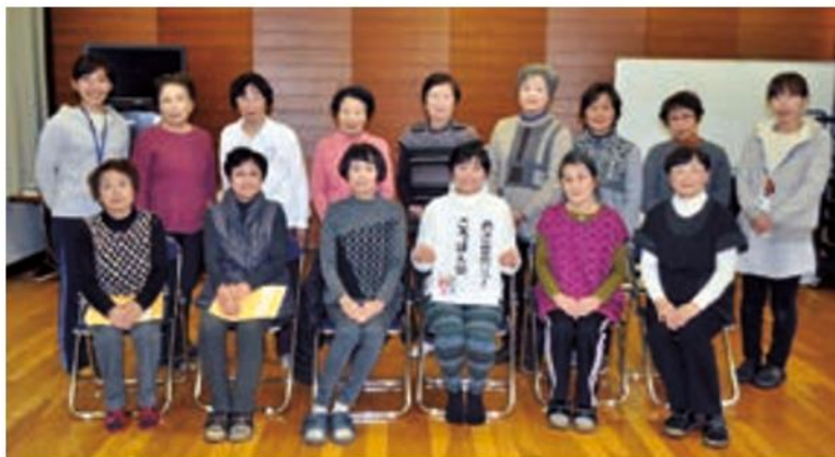
矢尾ころばん塾 (毎週水曜)