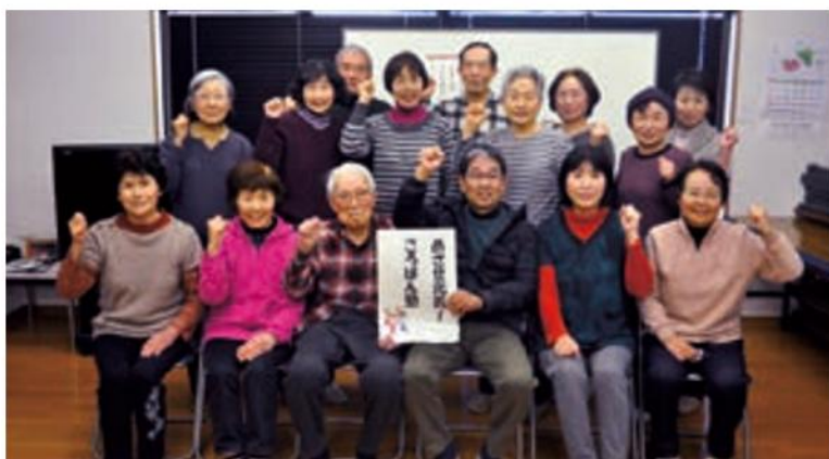
日笠山ころばん塾 (毎週木曜)