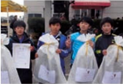
小学生男子 上南AC Aチーム