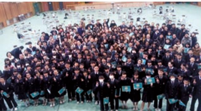
参加していただいた地域の大人のみなさん、大学生のみなさん、ありがとうございました。

だっぴでは、中学1年生104名と大学生40名、おとな52名の3者が、26グループに分かれて輪になり、いろんなトークテーマに沿って語り合