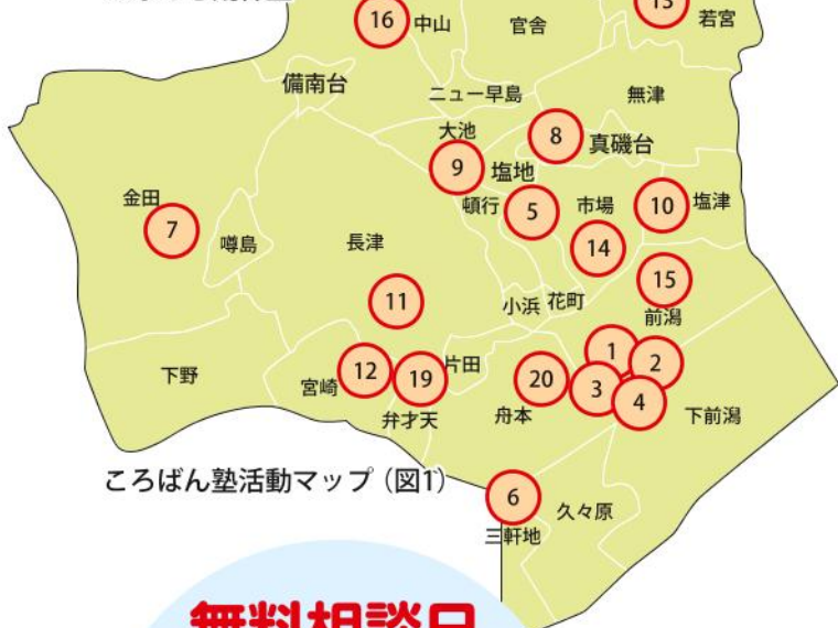
ころばん塾活動マップ (図1)