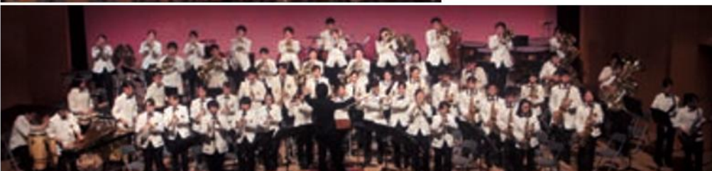
◀倉敷高校吹奏楽部