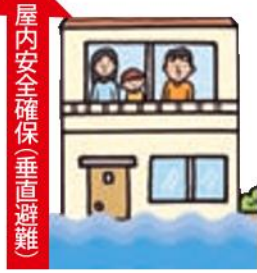
屋内安全確保(垂直避難)

屋外への移動(立ち退き避難)は危険です。浸水による建物倒壊の危険がないと判断される場合には、屋内の2階以上(土砂災害の場合は、斜面と反対側の部屋)へ緊急に一時避難し、救助を待つことも検討してください。