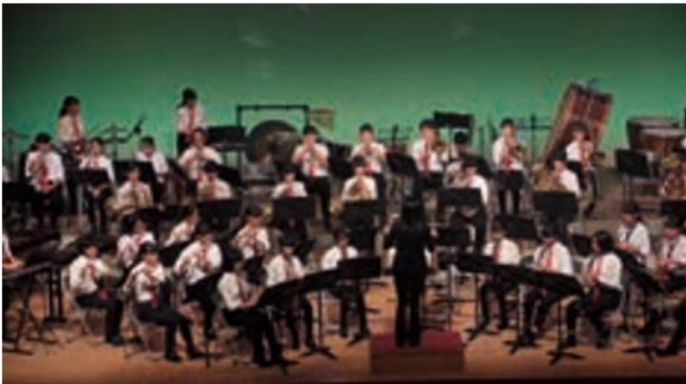
◀早島中学校吹奏楽部

来場者からは「普段一生懸命練習している姿が目につかんだ」「演出が素晴らしい」などの意見が寄せられました。