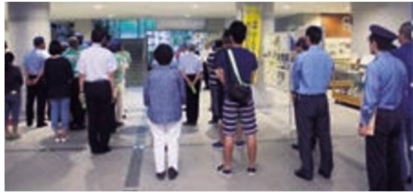
夜間巡回活動出発式

夜間巡回活動がスタート。なお早島交番自主パトロール隊は、夏休み中、防犯パトロール活動を実施しました。早島町青少年育成推進協議会は、他にも子どもたちの健全育成を図るため、早島交番自主パトロール隊、地域安全推進員、小・中学校PTAの皆さんと、子ども110番連絡所約70か所に日頃のお礼や様子を伺いする巡回活動を行いました。