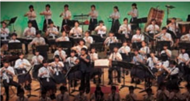
◀東陽中学校吹奏楽部