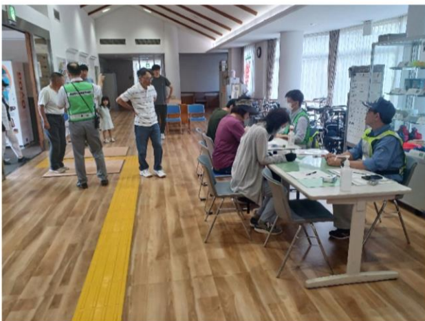
1階ロビー 避難者受入